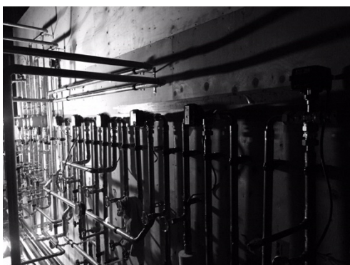
屏風岩実験装置（屏風岩の冷水を活用した保冷倉庫実験装置）