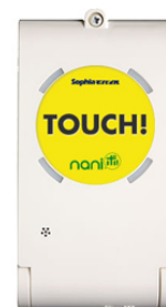
タッチをもっと簡単に!